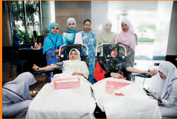
• Blood Donation Drive Kempen Derma Darah

Your Company's contribution towards nation building also includes the celebration of fifty (50) years of Malaysia - through donation. It is also known as the "Konvoi 50 Tahun Kemerdekaan". Your Company also initiates effective knowledge sharing and dissemination to the stakeholders. For the latter, your Company has been diffusing subject matters such as ICT security, intellectual property rights, data protection and privacy. Your Company has positioned itself being an opinion leader in Malaysia. Invariably, your Company has been active in instilling data protection awareness amongst Malaysians and is involved with various consultations to expedite the Data Protection Bill in the nation's legislative process.